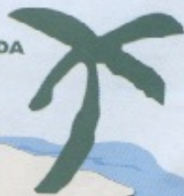
TABELA PARA COBRANÇA DA TAXA DE LICENÇA DE ABATE DE ANIMAIS E TRANSPORTE DE CARNE